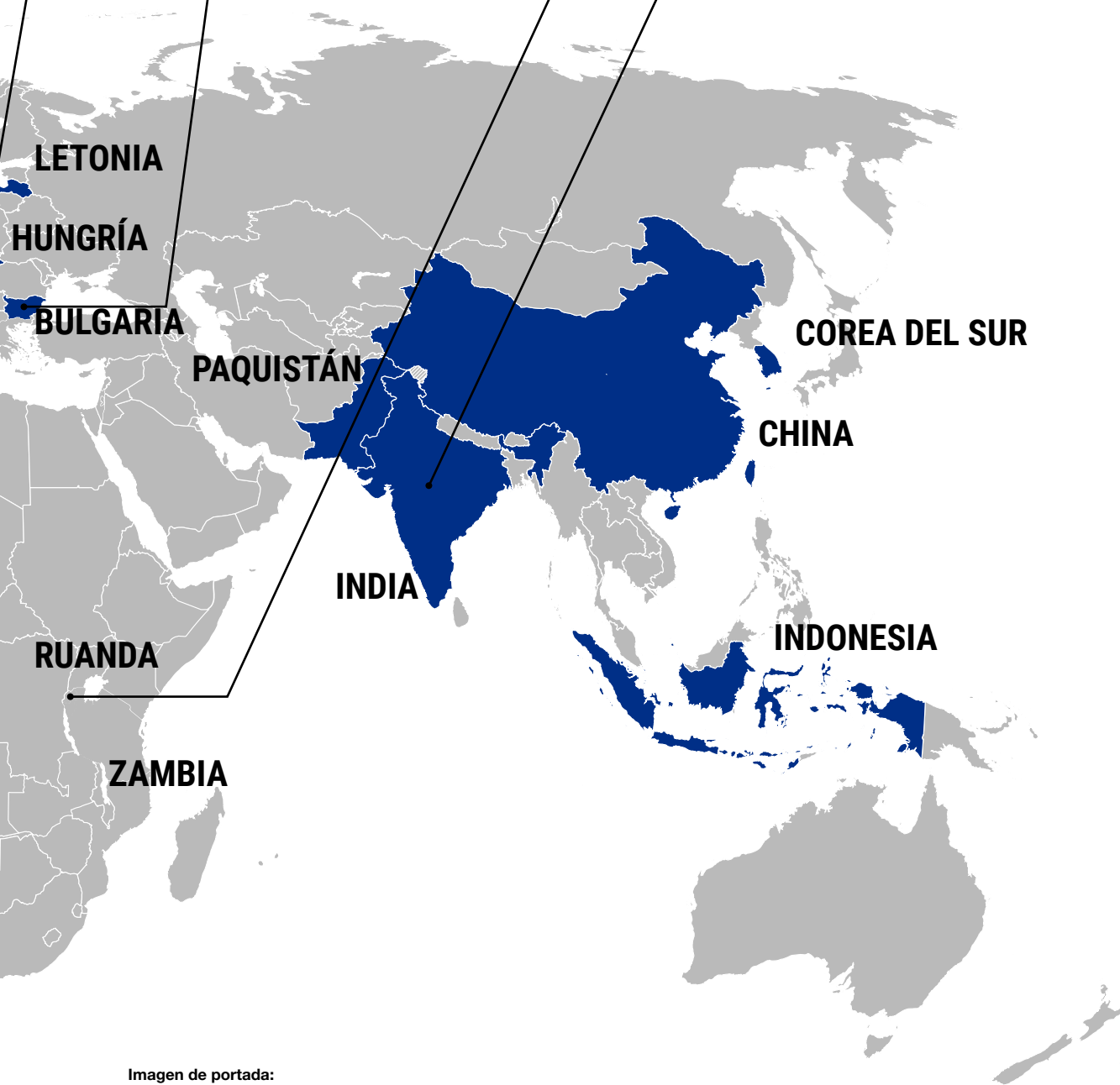
Imagen de portada:

Por Glorandal – elaboración propia, CC BY-SA 4.0